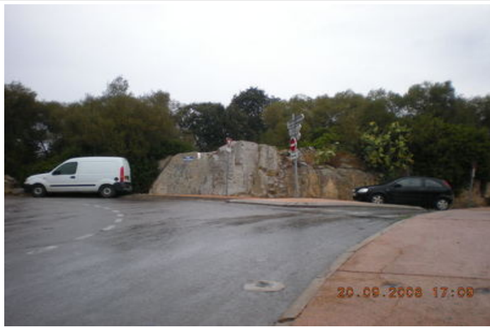
Azimut de la prise de vue : 380 gr