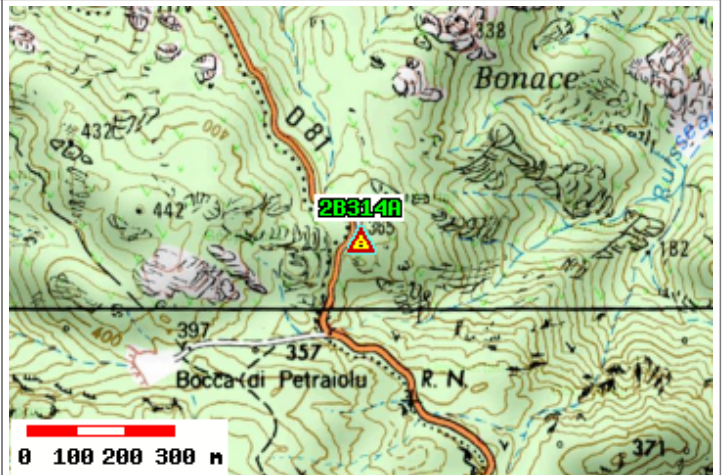
Carte : 4248 SAINT-FLORENT

Orientement : b : Repère 1996 A partir du repère a : Repère 1996