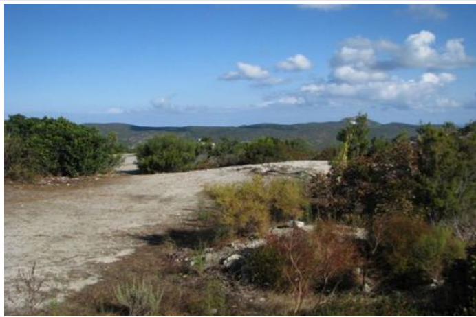
Azimut de la prise de vue : 390 gr